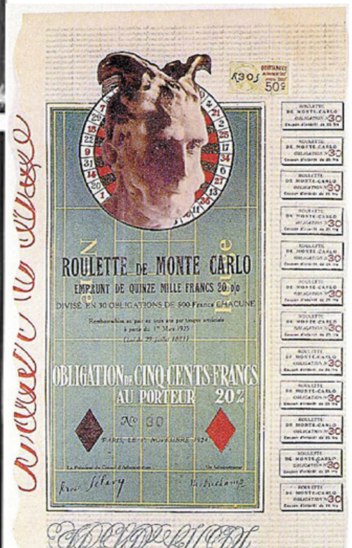
Monte Carlo Bond n°30, technique mixte, 1924

En ce début de XXe siècle, les rouages de la révolution industrielle voient naître une nouvelle dimension économique pour l'œuvre d'art, celle de la spéculation. Marcel Duchamp, à l'instar des mouvements Dada et Surréaliste auquel il participera, va entreprendre alors une sorte de dématérialisation de l'œuvre fondé sur un paradoxe ambitieux entre les valeurs économiques et spirituelles. L'œuvre d'art est avant tout pour lui un acte pour l'esprit qu'une valeur imposé par le marché de l'art : des œuvres à l'épreuve de la valeur, pleines de jeux d'esprit qui ironisent et s'amuse des nouvelles stratégies marketing de l'époque mêlant le scandale et l'incessant renouvellement de la nouveauté.